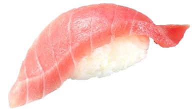
『大切り中とろ』商品画像