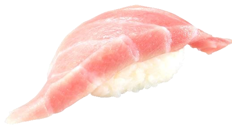
『大切り大とろ』商品画像