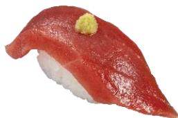
『本鮪上赤身わさびのせ』 一貫 242円（税込）

旨みがしっかりとしたネタとかっぱ寿司自慢のシャリがベストマッチ。鮪の美味しさを感じてください。