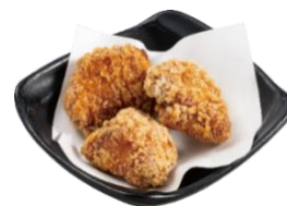
『とりあん監修 醤油唐揚げ』 429円（税込）

冬に向けて旨みがグンと増すネタを一度に三貫楽しめる一皿です。活×寒ぶり、蟹みそ和え、柚子塩活×真鯛を取り揃えました。