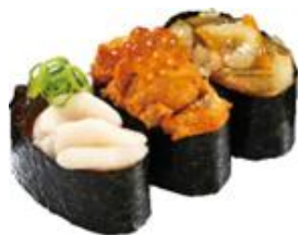
『冬の旨ネタ三昧』 三貫 242円（税込）

【かっぱの冬！ごちネタ】 販売期間：2022年12月14日（水）～2023年1月9日（月・祝）予定