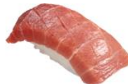
『本鮪とろ』 一貫 363円（税込）

旨みがしっかりとしたネタとかっぱ寿司自慢のシャリがベストマッチ。鮪の美味しさを感じてください。