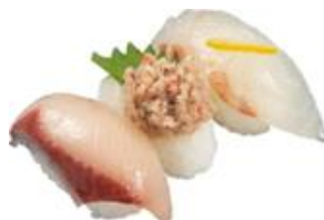
『冬の味わい三昧』 三貫 363円（税込）

冬に美味しい真鱈白子、あん肝、年末年始定番の松前風軍艦を一皿でお楽しみいただけます。