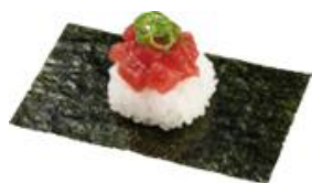
『本鮪上赤身ぶつ切り包み』 一貫 110円（税込）

【かっぱの本鮪祭り】 販売期間：2022年12月14日（水）～12月26日（月）予定