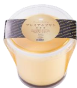
お持ち帰り用 プレミアムプリン 320円（税込）