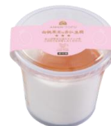
お持ち帰り用 白桃果実の杏仁豆腐 320円（税込）