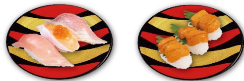
父の日 W ごち寿司セット 六貫 1,100 円（税込）

“とろ三味～みなみ鯖中とろ使用～” “贅沢うに三味” の二皿がセットになった、贅沢かつお得なセットです。