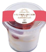
お持ち帰り用 いちご練乳の杏仁豆腐 320円（税込）