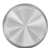
『カプセルトイコイン』 190 円（税込）～