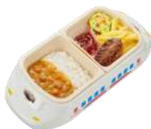
『おこさまカレーと ハンバーグセット』 通常価格 510 円（税込）～