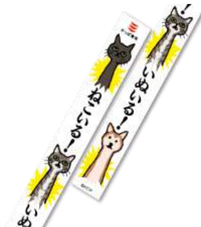
マスキングテープ A

大好きなあのシーンが、ミニメモパッドで楽しめちゃう！ちょっとしたメモも楽しくなるアイテムです。