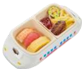
『おこさまにぎりと ハンバーグセット』 通常価格 510 円（税込）～

かっぱ寿司では、おこさまから人気のネタやカレーを「新幹線プレート」に乗せてお届けするメニューや、小さなおこさまでも食べやすいよう短くカットされた「うどん」など、ワクワクするメニューが勢揃い！