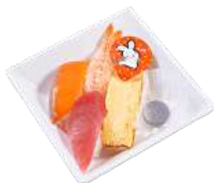
『おこさまプレート』 通常価格 310 円（税込）～