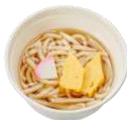
『おこさまうどん』 通常価格 310 円（税込）～