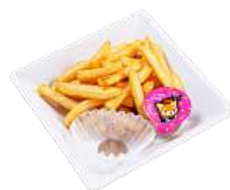
『おこさまポテトプレート』 通常価格 310 円（税込）～