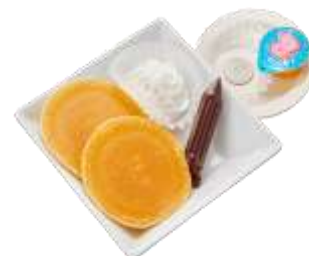
『おこさまパンケーキ』 通常価格 510 円（税込）～