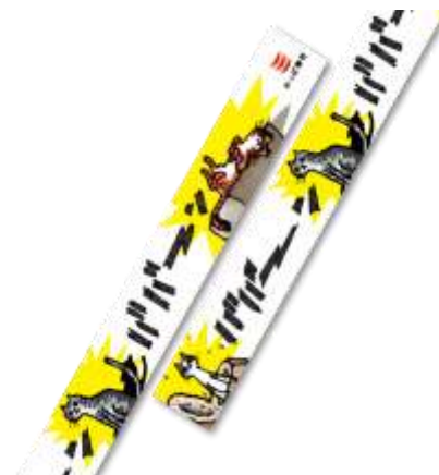
マスキングテープ B

「ねこいる！」…ときどき「いぬいる！」遊び心たっぷりのマスキングテープを、好きなところに貼って楽しんでください！