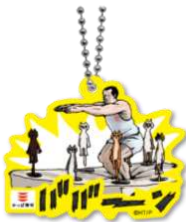
ラバーキーホルダー B

「ねこいる！」の世界観がぎゅっと詰まった、ラバーキーホルダー。バッグやポーチにつけて、いつでも「ねこいる！」を楽しめます♪