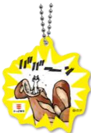
ラバーキーホルダーA

「ねこいる！」の世界観がぎゅっと詰まった、ラバーキーホルダー。バッグやポーチにつけて、いつでも「ねこいる！」を楽しめます♪