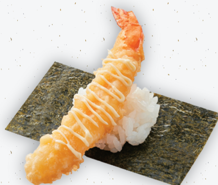
店内揚げ 大えび天包みマヨ ※[マヨネーズ]使用