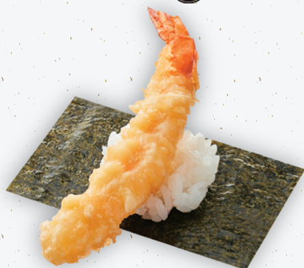
店内揚げ 大えび天包み