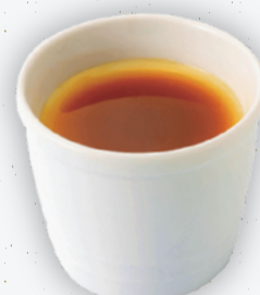
店内仕込 プレミアムプリン (試食会特別提供商品)