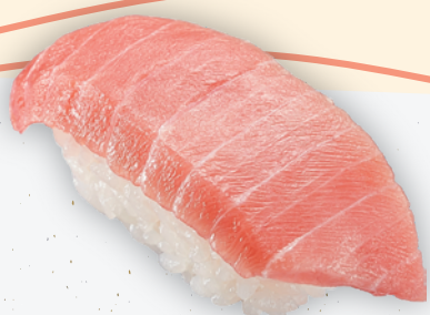
店内切付 みなみ鮭 中とろ