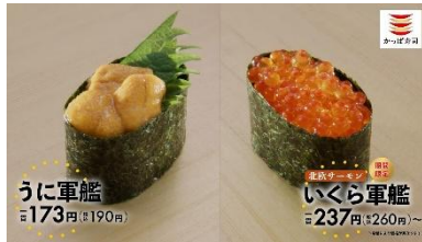
<下野さん歌>とろけるうにはじける いくら♪