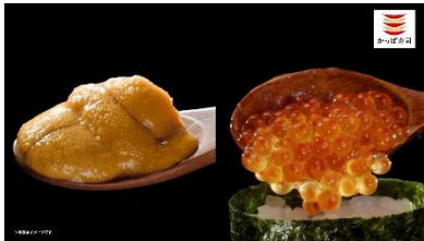
<下野さん歌>かっぱかっぱ