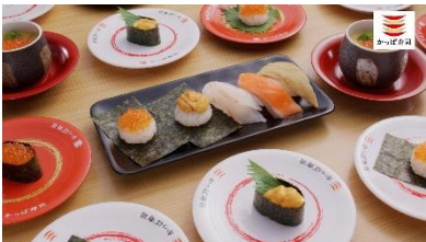
<下野さん歌>かっぱかっぱぜいたくネタ を召し上げ!