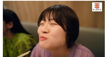
<下野さん合いの手>うまっ!