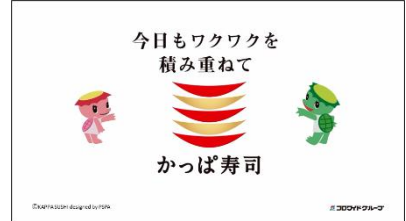
<下野さん SL>かっぱ寿司♪