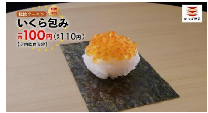
<下野さん合いの手>おっ得っ!