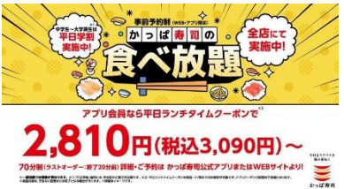
<下野さん NA>食べ放題も!?