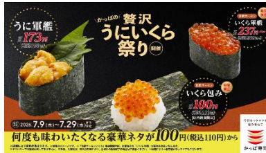
<下野さん NA>贅沢うにいくら祭り!