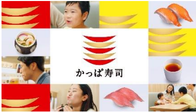
<下野さん歌>かっぱかっぱ